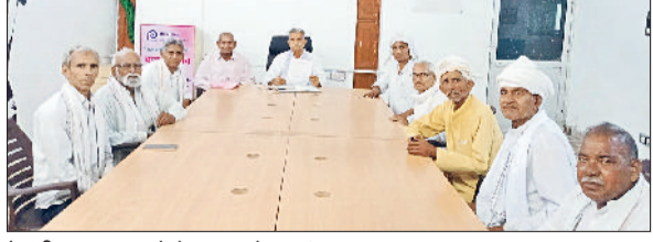
रेवाड़ी। बाल भवन में बैठक करते हुए नंबरदार।