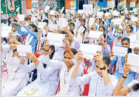
रेवाड़ी। गर्ल्स स्कूल में टैबलेट दिखाते हुए छात्राएं। फाईल फोटो।

डिजिटल शिक्षा को बढ़ावा देने और जरूरतमंद परिवारों के बच्चों को ऑनलाइन शिक्षा प्रदान करने के उद्देश्य से शिक्षा विभाग की ओर से ई-अधिगम योजना के तहत सरकारी स्कूलों के कक्षा 9 से 12 तक के 18 हजार में से 15 हजार विद्यार्थियों को टैबलेट वितरित किए गए थे, लेकिन अभिभावकों का रुझान कम होने और पोर्टल की तकनीकी उलझनों की वजह से ढाई हजार से अधिक विद्यार्थी टैबलेट लेने से वंचित हैं। विद्यार्थियों को टैबलेट प्रतिवर्ष वार्षिक बोर्ड परीक्षाओं से पूर्व लौटाने होते हैं, जिसके लिए शिक्षा निदेशालय की ओर से जिला शिक्षा अधिकारियों को निर्देश दिए गए थे। निदेशालय ने