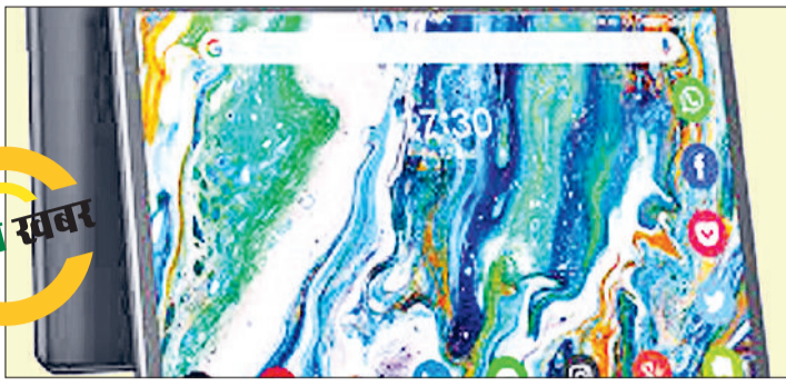
पुराने टैबलेट नए छात्रों को, बड़ी नाराजगी योजना के तहत 12वीं कक्षा पास करने वाले विद्यार्थियों से टैबलेट वापस लेकर उन्हें नए छात्रों को दिया जा रहा है। इस प्रक्रिया ने नई समस्याएं खड़ी कर दी हैं। कई छात्रों को ऐसे टैबलेट मिल रहे हैं जो पहले से इस्तेमाल किए जा चुके हैं और उनकी स्थिति संतोषजनक नहीं है।

टैबलेट तकनीकी खराबी के कारण डैमेज पाए गए हैं। कई जगह छात्रों ने शिकायत की है कि टैबलेट सही से चालू नहीं होते, लॉक सिस्टम खराब है या बार-बार हंग हो जाते हैं। ऐसे में डिजिटल शिक्षा का उद्देश्य ही प्रभावित हो रहा है। छात्रों और शिक्षकों का कहना है कि टैबलेट मिलने के बावजूद पढ़ाई में अपेक्षित लाभ नहीं मिल पा रहा। परिजनों का कहना है कि सरकार नई तकनीक देने का दावा कर रही है, लेकिन हकीकत में बच्चों को पुराने और खराब डिवाइस दिए जा रहे हैं, जिससे उनका उत्साह भी कम हो रहा है।