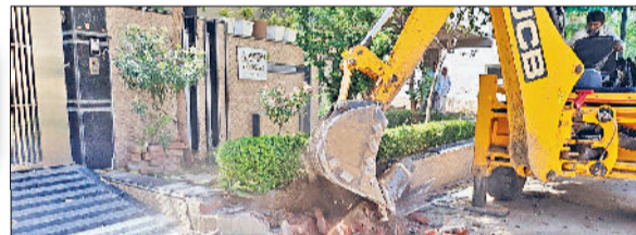
रेवाड़ी। लाइसेंस कॉलोनियों से अतिक्रमण हटती जेसीबी।

डीटीपी की ओर से लाइसेंस कॉलोनियों में सीमा से अधिक जगह पर रैंप, ग्रीन बेल्ट व लॉन बनाकर अतिक्रमण करने वाले लोगों पर कार्रवाई शुरू कर दी गई है। कॉलोनियों में रहने वाले लोगों को खुद अतिक्रमण हटाने की सलाह दी गई थी। पंजाब एवं हरियाणा हाईकोर्ट के स्टिल्ट प्लस फोर पॉलिसी पर दिए गए आदेशों के बाद प्रदेश सरकार की ओर से सभी जिलों के डीटीपी को कार्रवाई करने के लिए पत्र जारी किए जा चुके हैं। डीटीपी की टीम ने बुधवार को गढ़ी बोलनी