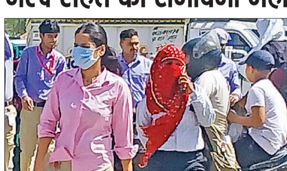
रेवाड़ी। बुधवार को तेज धूप का बचाव करती युवतियां।