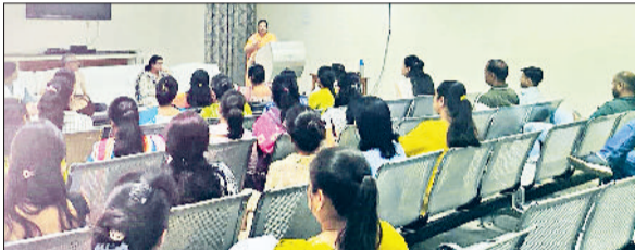
रेवाड़ी। कार्यशाला में जानकारी देते हुए वक्ता।

नगर परिषद और धारूहेड़ा नगर पालिका चेररमैन पद के प्रत्याशियों की घोषणा में बाजी मार चुकी कांग्रेस 23 अप्रैल को दोनों प्रत्याशियों के नामांकन के समय शहर में ताकत दिखाने में कोई कसर नहीं छोड़ेगी। भाजपा की प्रत्याशियों के नाम घोषित करने में देरी को भी कांग्रेस ने मुद्दा बनाकर पेश करना शुरू कर दिया है। दोनों निकाय में महिलाओं को प्रत्याशी बनाने के बाद कांग्रेस ने महिला आरक्षण बिल को लेकर भाजपा पर निशाना साधने में कोई कसर नहीं छोड़ी है। नगर परिषद चेररमैन का पद एएससी महिला के लिए आरक्षित है, जबकि धारूहेड़ा नगर चेररमैन का पद ओपीएस के लिए है। कांग्रेस ने रेवाड़ी के साथ-साथ धारूहेड़ा में भी महिला को ही प्रत्याशी बनाया है।