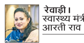
रेवाड़ी। स्वास्थ्य मंत्री आरती राव।

हरियाणा सरकार ने रेवाड़ी जिले को करीब एक दर्जन स्वास्थ्य केंद्रों की सौगात दी है। जिले में पांच स्वास्थ्य केंद्र अपग्रेड किए गए हैं, जबकि छह नए स्वास्थ्य केंद्र खोलने की मंजूरी दी गई है। केंद्रीय मंत्री राव इंद्रजीत सिंह ने प्रदेश की स्वास्थ्य मंत्री आरती राव को पत्र लिखकर जिले के पांच स्वास्थ्य केंद्रों को अपग्रेड करने तथा छह नए स्वास्थ्य केंद्र खोलने के लिए अनुरोध किया था, जिस पर स्वास्थ्य मंत्री ने स्वास्थ्य विभाग को कार्रवाई करने के निर्देश