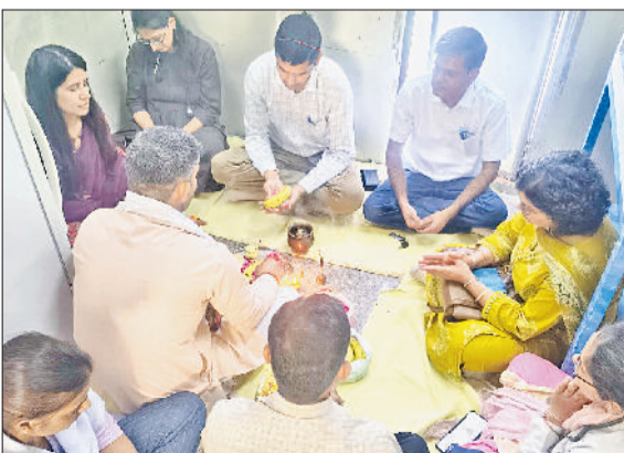
रेवाड़ी। नागरिक अस्पताल में कीमोथेरेपी सेंटर के शुभारंभ पर पूजा करती टीम।