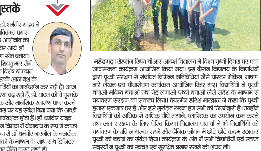
महेंद्रगढ़। सेहलंग स्थित बीआर आदर्श विद्यालय में विश्व पृथ्वी दिवस पर एक जागरूकता कार्यक्रम आयोजित किया गया।

इन्होंने योग के कठिन व गूढ़ सिद्धांतों को अत्यंत सरल और सहज भाषा में प्रस्तुत किया है। ये पुस्तकें हिंदी व अंग्रेजी दोनों भाषाओं में उपलब्ध हैं, ताकि भाषाई बाधा के बिना ज्ञान का प्रसार हो सके। प्रमुख पुस्तकों की सूची: योगसार, योगियों का जीवन परिचय, बायोग्राफी ऑफ योगीग, योग ए व् ओफ लाइफ हिंदी संस्करण, योग ए व् ओफ लाइफ अंग्रेजी संस्करण, नैचुरोपैथी ए व् ओफ लाइफ हिंदी संस्करण, नैचुरोपैथी ए व् ओफ लाइफ अंग्रेजी संस्करण, योगवशिष्ठ सार, गीता योगामृत व शंख प्रक्षालन आदि शामिल हैं।